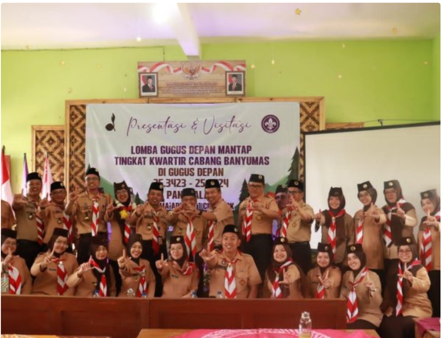
Satya Darma MA Ma'arif NU 1 Cilongok jadi Tuan Rumah Visitasi Gudep Mantap Kwarcab Banyumas

CILONGOK - MA Ma'arif NU 1 Cilongok, Banyumas, Jawa Tengah, kembali meneguhkan perannya sebagai madrasah penggerak kepramukaan.