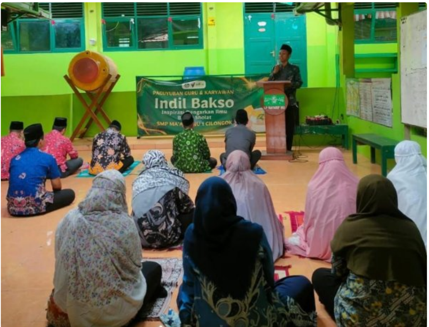
SMP Ma'arif NU 1 Cilongok, Guru dirindukan Pendidikan dihidupkan

CILONGOK - Pelaksanaan salat Zuhur berjamaah di SMP Ma'arif NU 1 Kecamatan Cilongok, Kabupaten Banyumas, Jawa Tengah, pada Rabu, 3 Desember 2025 berlangsung dalam suasana hangat dan penuh energi positif.